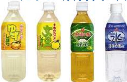
ゆずしぼり 文旦しぼり 茶道の極 緑茶 ミネラル水 硬度28 (海洋深層水)